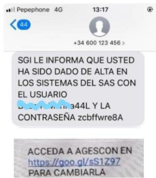
SMS Usuario nuevo

Recuerde que debe cambiar su contraseña accediendo a AGESCON desde su casa, o utilizando cualquier ordenador del Hospital o Centro de Salud.